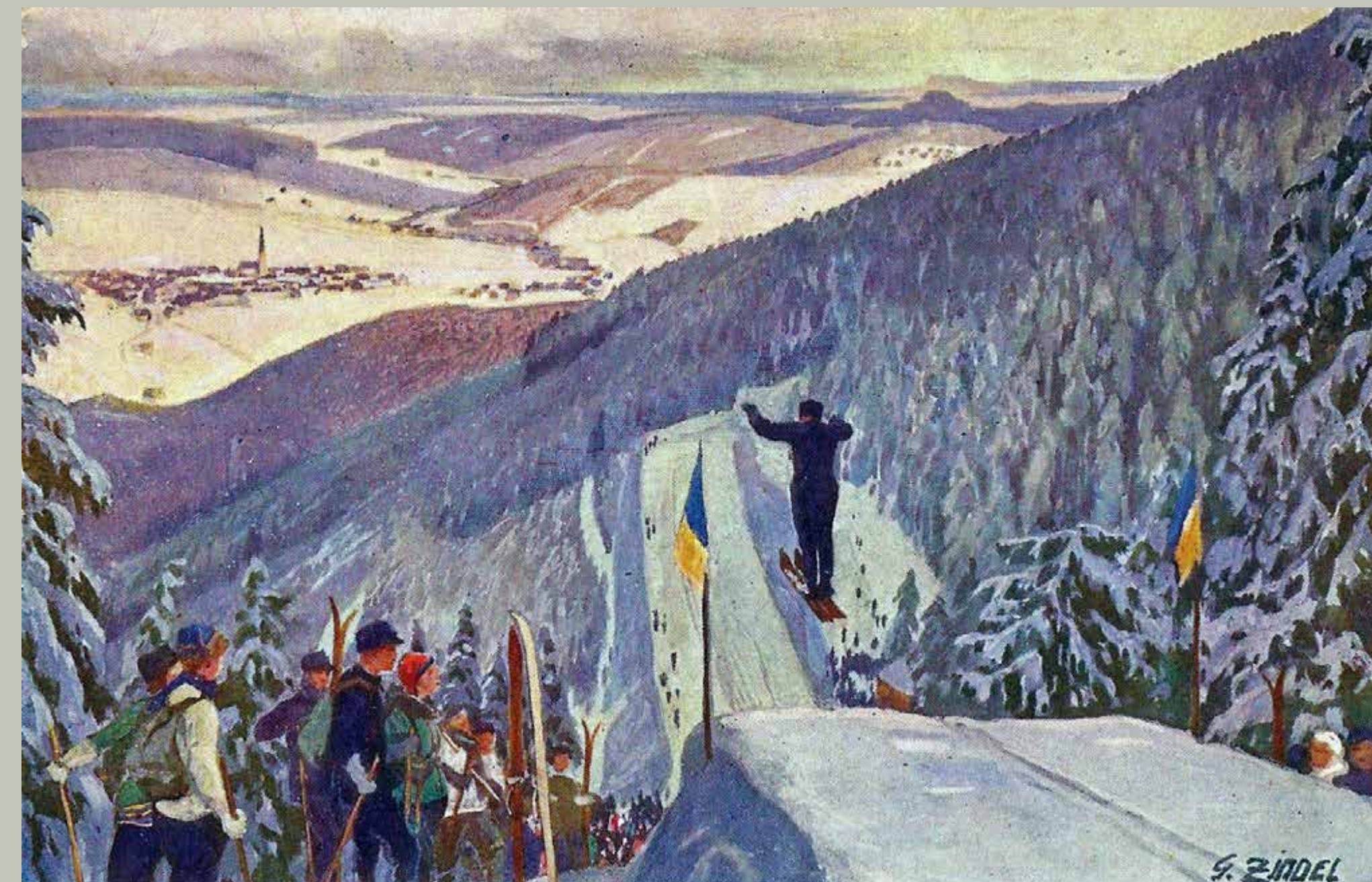
Někdejší skokanský můstek v Liščí díře na Klínovci (20. léta 20. století)