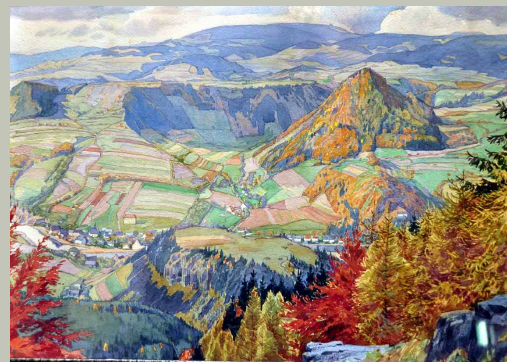
Podkrušnohorská krajina Landschaft des Erzgebirgsvorlandes