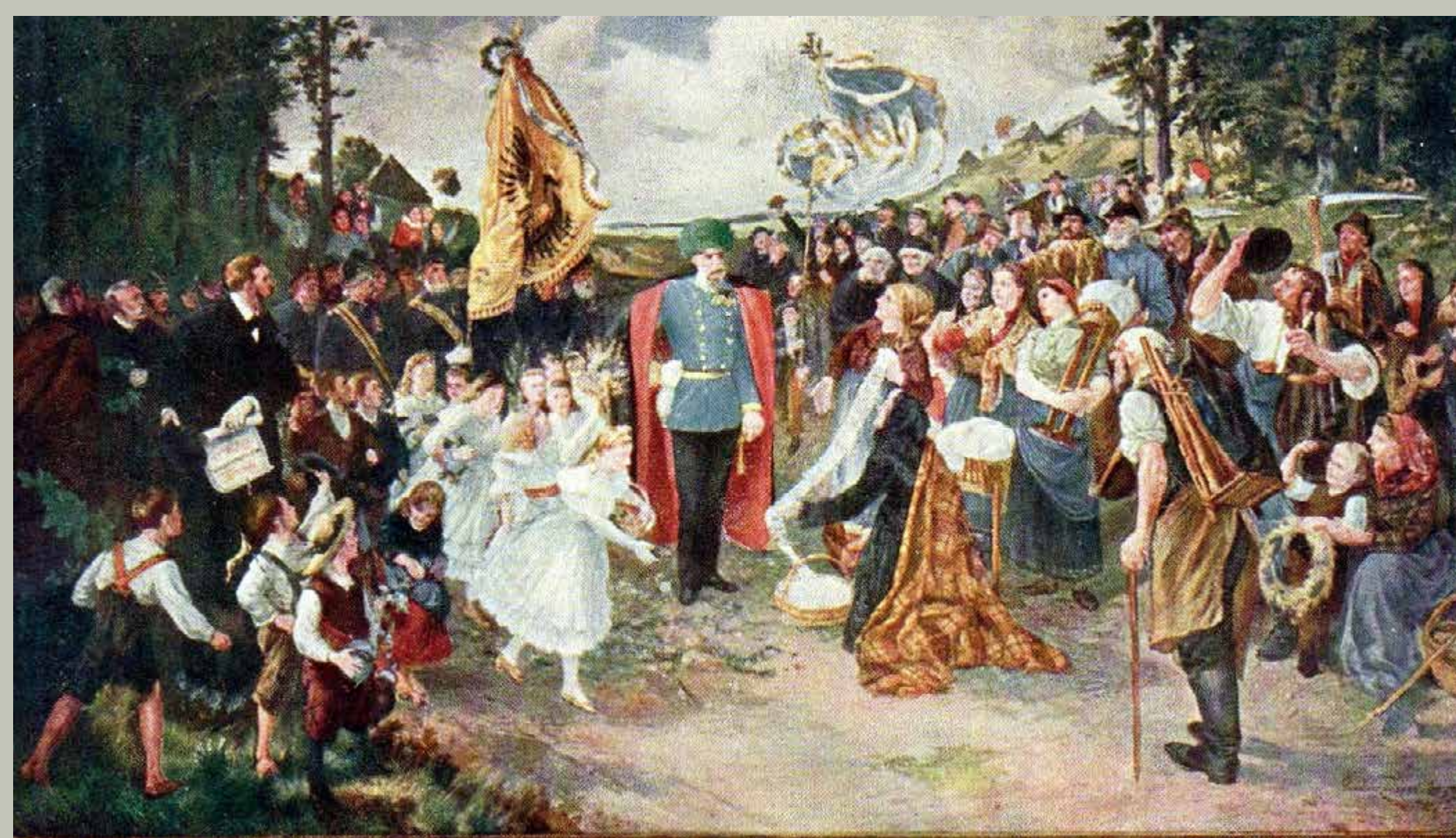
Zindelův obraz „Krušné hory vzdávají hold císaři Františku Josefu I.“ je dnes uložen v muzeu v bavorském Marktredwitzu Zindels Bild „Huldigung des Erzgebirges an Kaiser Franz Joseph I.“ wird heute im Museum im bayerischen Marktredwitz aufbewahrt

Der erste größte Auftrag Zindels und zugleich eines seiner bedeutendsten Bilder ist die großformatige (310 x 75 cm) Leinwand „Huldigung des Erzgebirges an Kaiser Franz Joseph I.“, das er für die Jubiläumsausstellung von Handwerks- und Industrieerzeugnissen des Erzgebirges gemalt hatte. Diese fand im Jahre 1908 anlässlich der Feierlichkeiten zum 60-jährigen Regierungsjubiläum des Kaisers auf dem Keilberg statt. Für die Ausstellung, auf der rund 40 000 Besucher gezählt wurden, wurde ein Zentralgebäude mit einer ausgedehnten Halle gebaut. Die Halle war mit einer Kassettendecke ausgeschmückt, auf der die Zeichen der 26 Städte des böhmischen Erzgebirges abgebildet waren. Auch für diesen Deckenschmuck zeichnete Gustav Zindel verantwortlich.