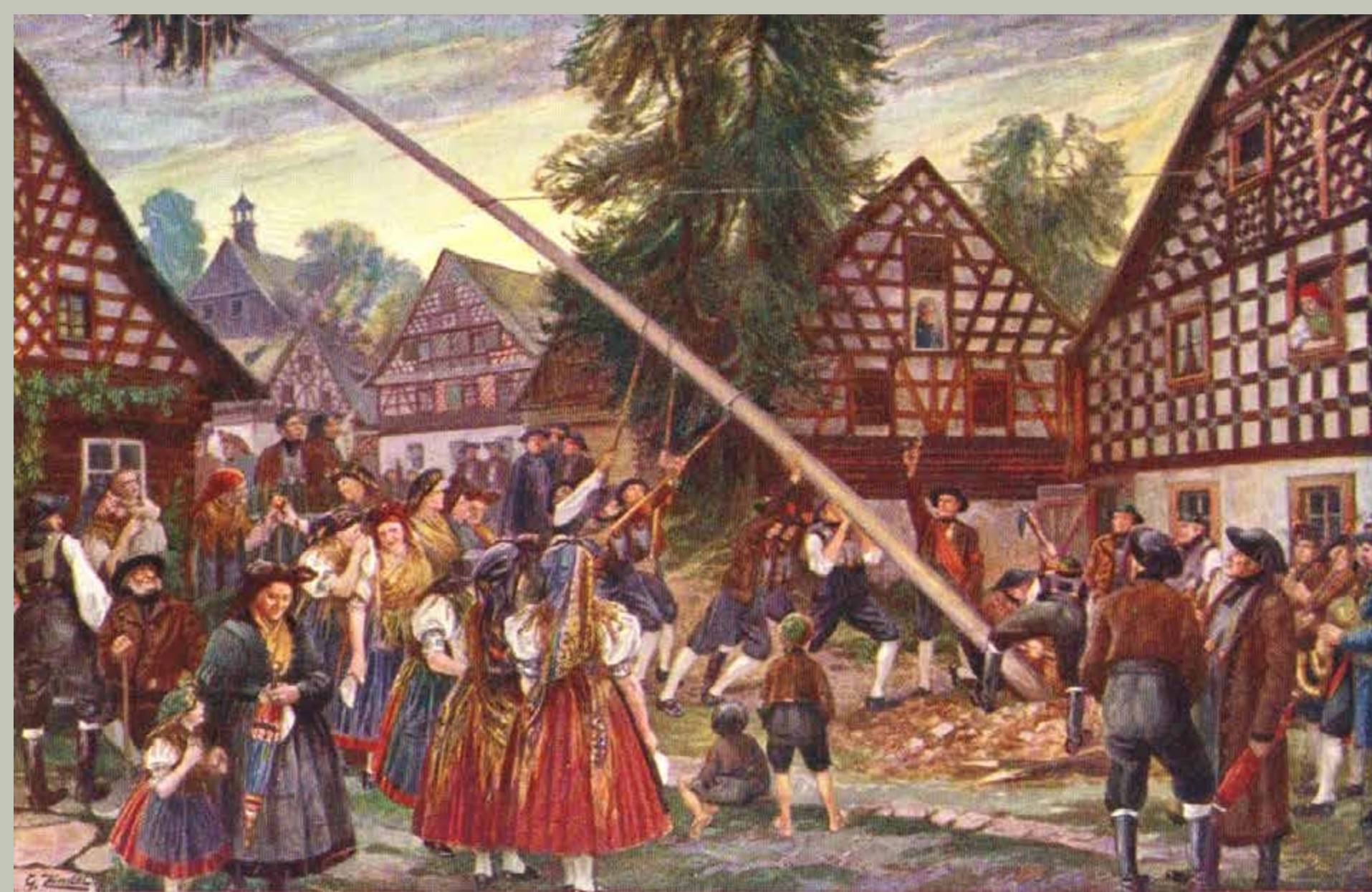
Stavění májky (cca 1915) Errichten eines Maibaums (ca. 1915)